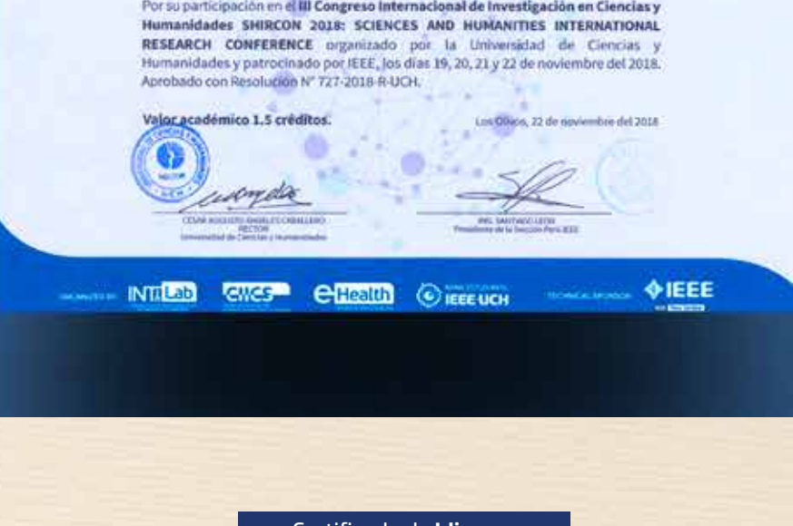
Certificados de participación