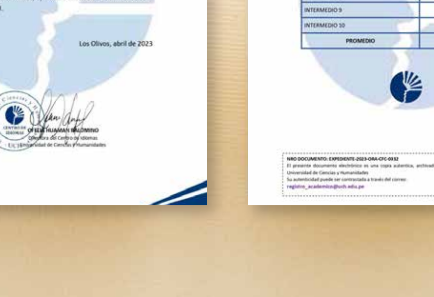
Certificado de Idiomas