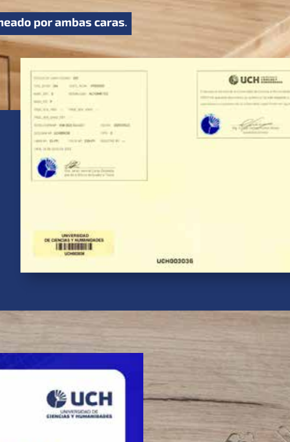
Modelo de Declaración Jurada