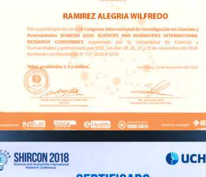
Constancia en calidad de ponente